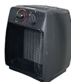
Termoventilatore Antigelo con termostato Cod. 40.4358.00