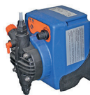
Pompa dosatrice per anticalcare a controllo elettronico 5 lt/h - 7 Bar Cod. 40.2379.00