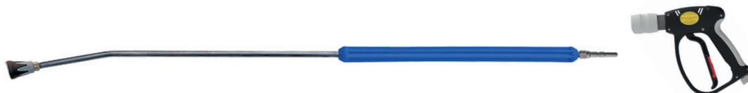
Lancia atermica INOX cm 90 senza ugello con pistola ad estrazione Ø14 Sez. 9.4 - Cod. 10.2219.00 Sez. 9.9 - Cod. 10.1364.00