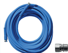
Tubo AP R2 3/8" da 15 mt. Antimacchia femmine zincate con pressature 3/8" Sez. 9.10 - Cod. 10.3534.00