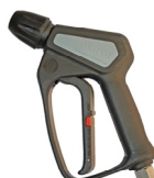
Pistola ad estrazione Ø 14 Cod. 25095/ST