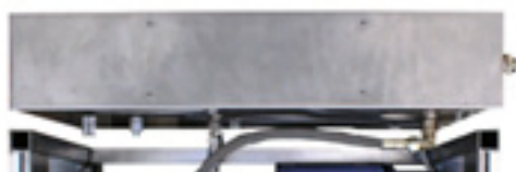
Vasca Inox 30 Litri completa di sensori di livello Cod. 2003