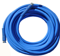
Tubo A.P. R/2 da 15mt. Antimacchia con pressature 3/8" femmine zincate Cod. 18215