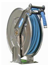
Arrotolatore automatico Inox (Senza Tubo) Cod. 10300 (Sez. 50)